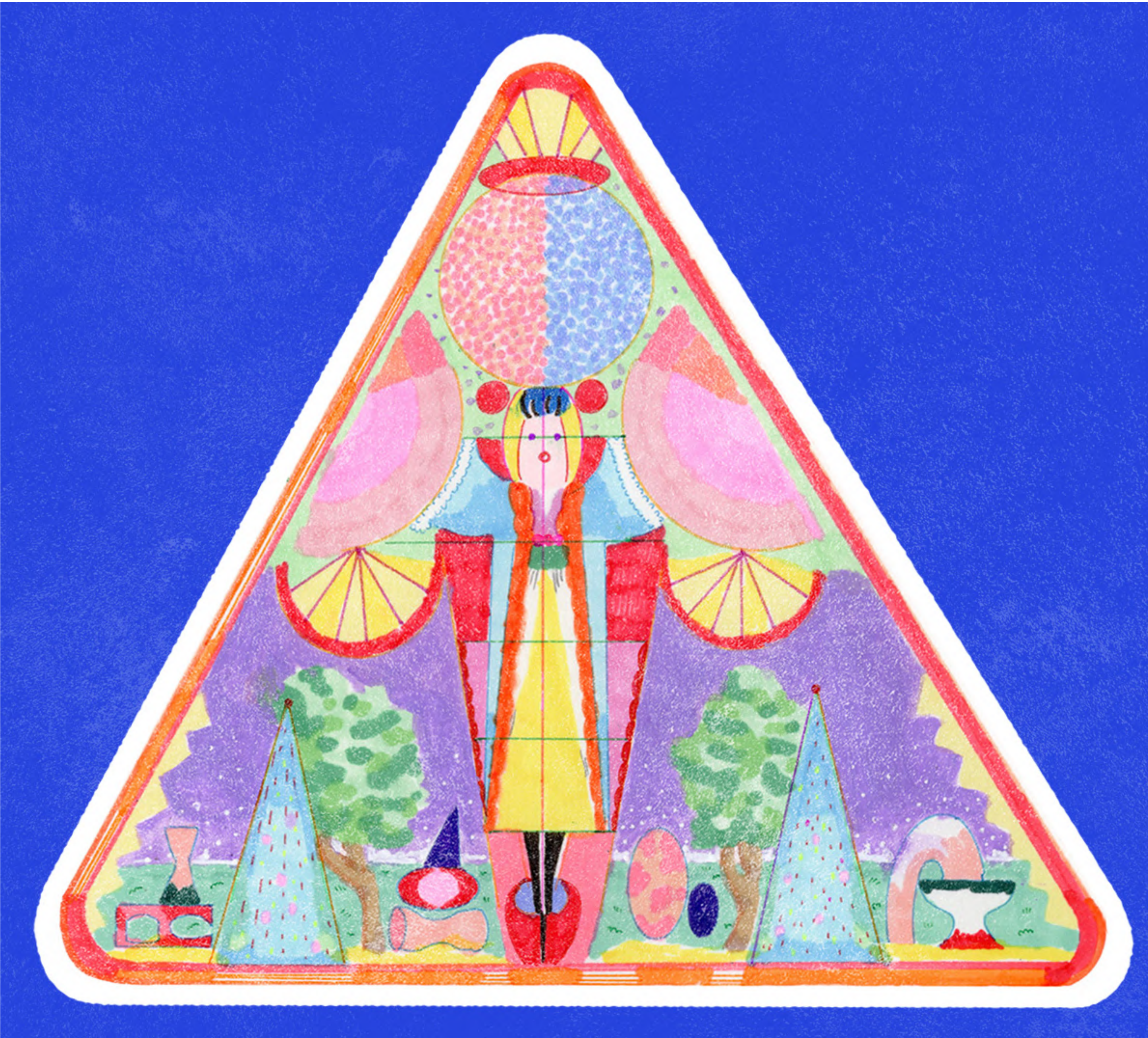
« Snowball Girl » 2024