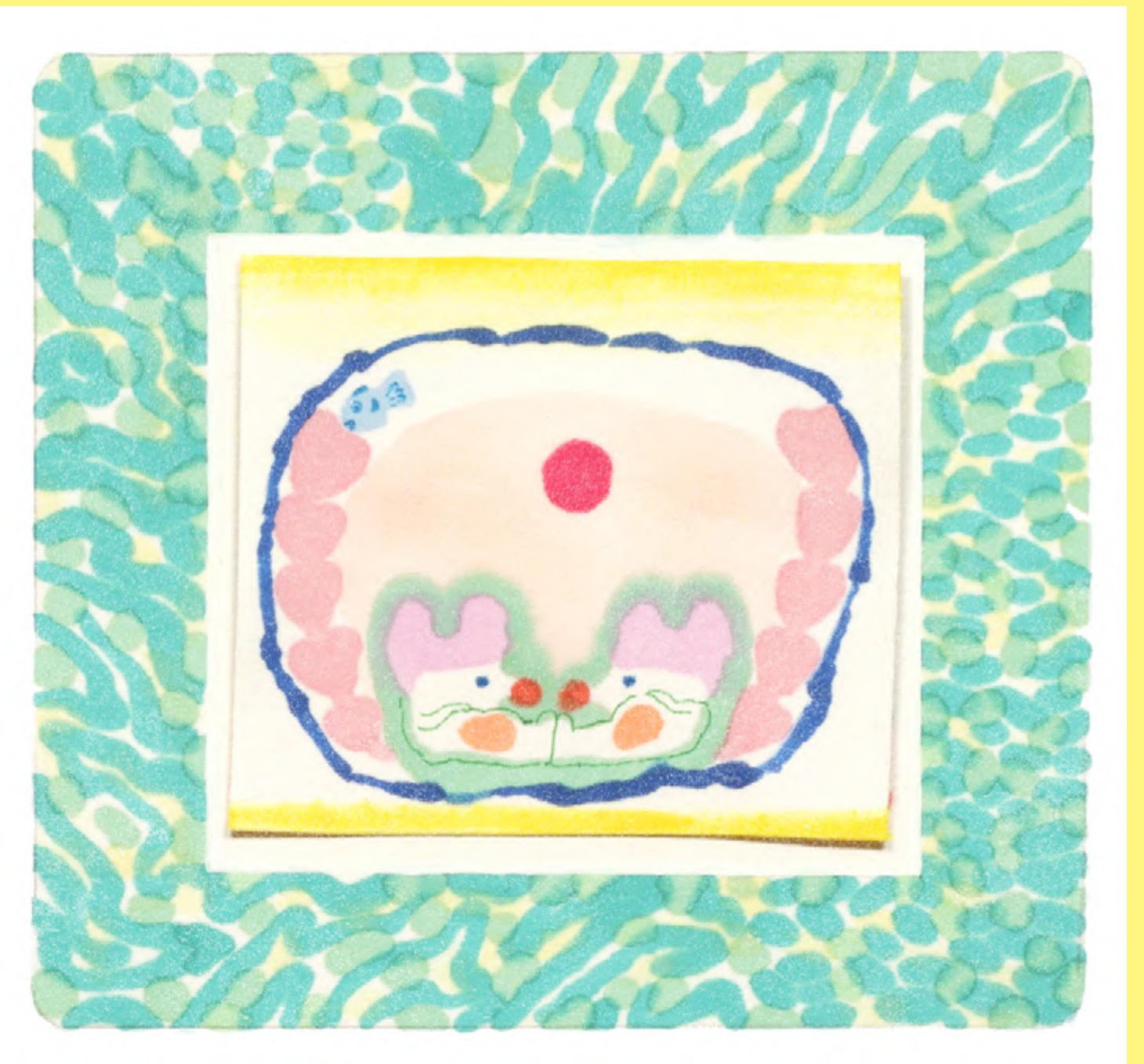
« Mousi » Personal Book Project 2024