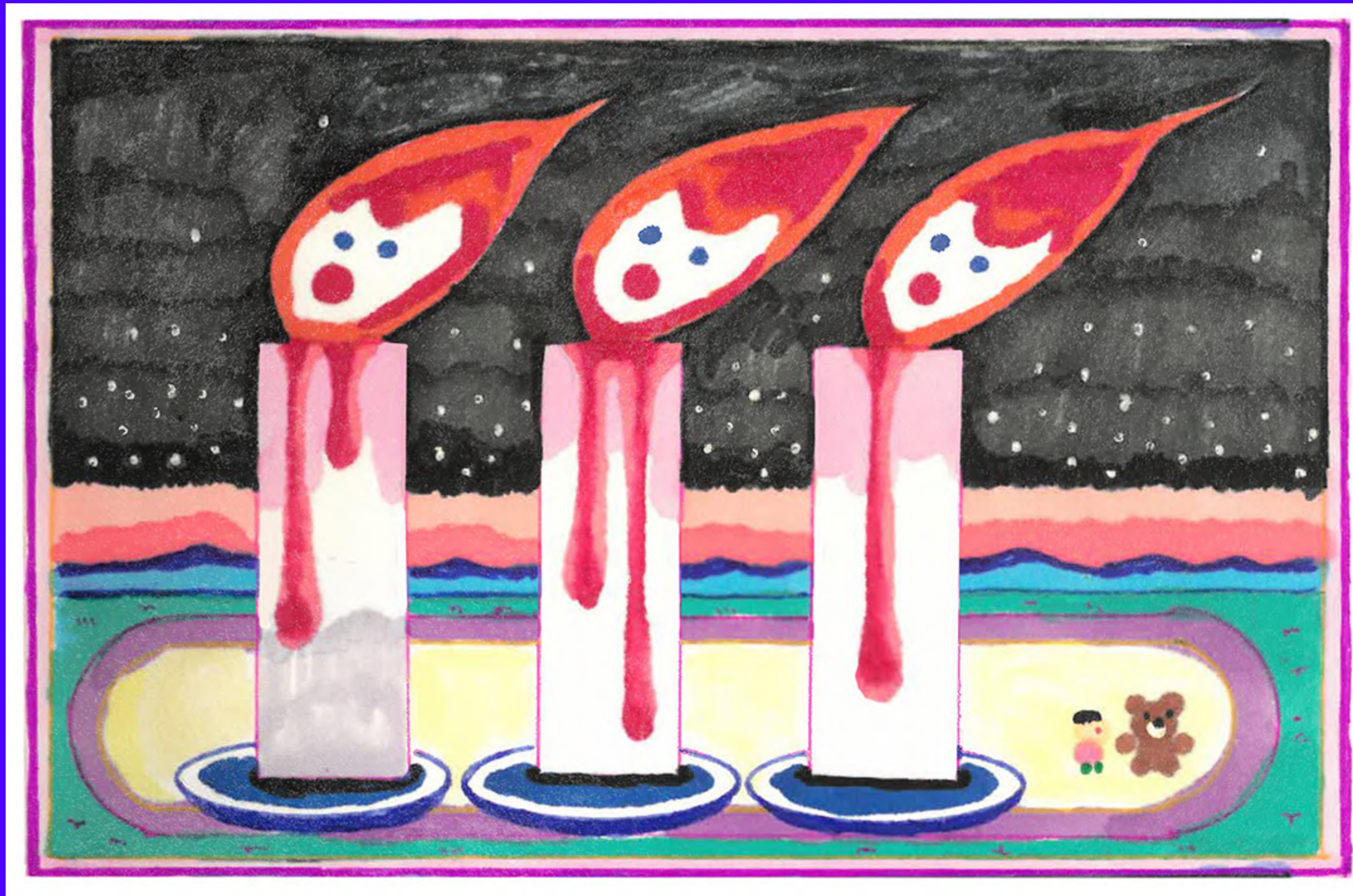
Illustration | Graphic Art