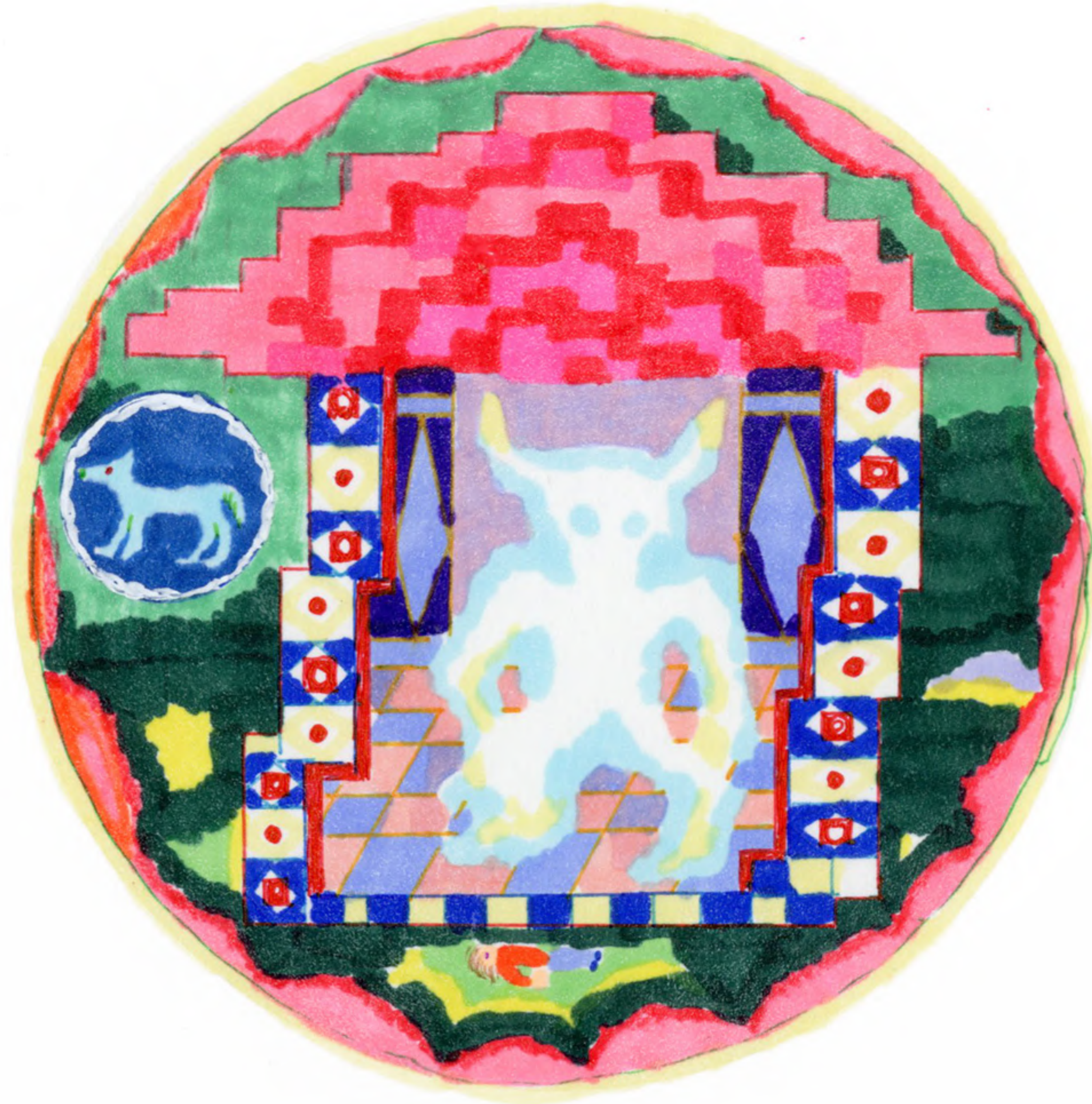
« Dream of Wolf » 2024