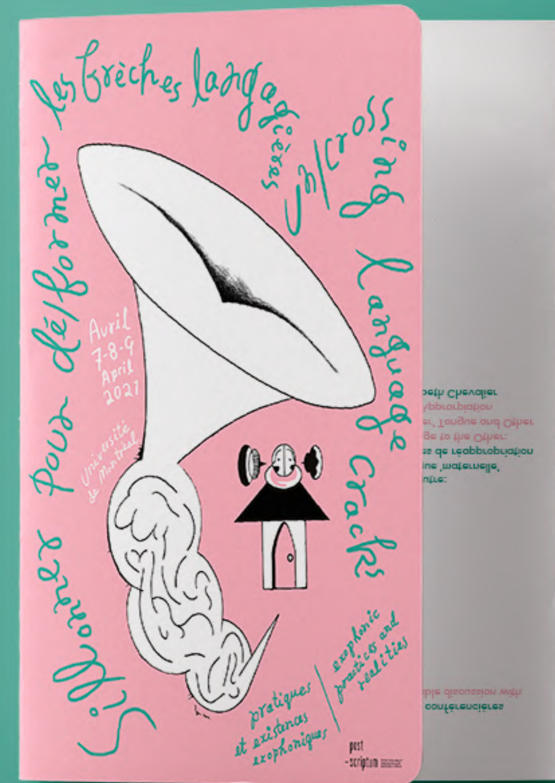
Illustration and Flyer Design Université Montréal, Canada 2023

Premier panel: Douleur des corps, trauma des langages/Bodies of Pain, Trauma of Languages Modération: François-Xavier Garneau