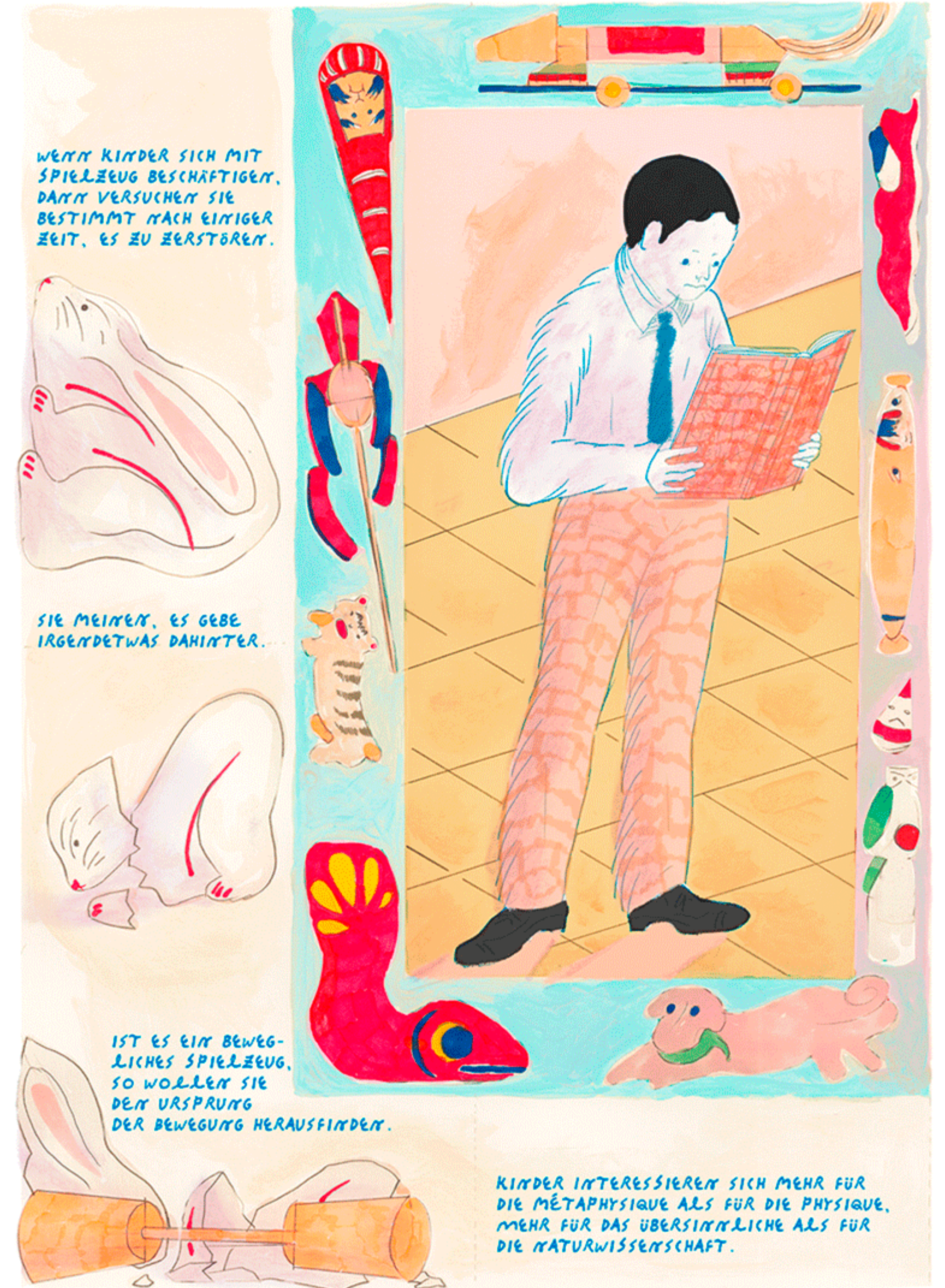
« HANAKO - Japanese Dancer in Europe » Comic Award 2023 Berthold Leibinger Foundation 2023