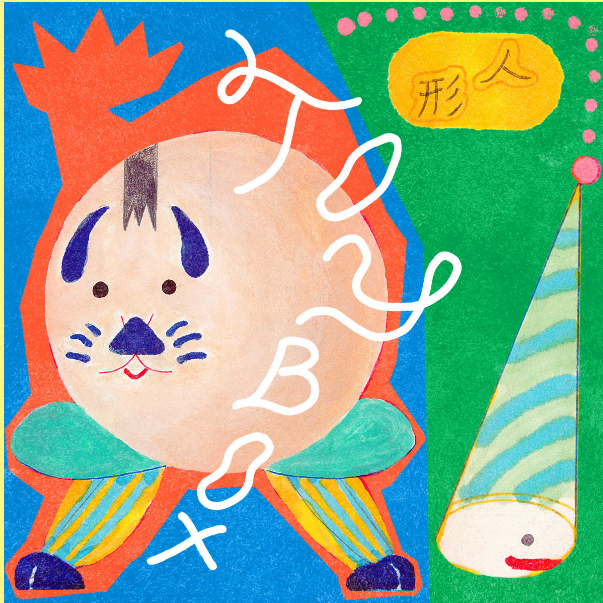
Illustration for Workshop "TOYBOX" International Comic Salon Erlangen 18, Germany 2024