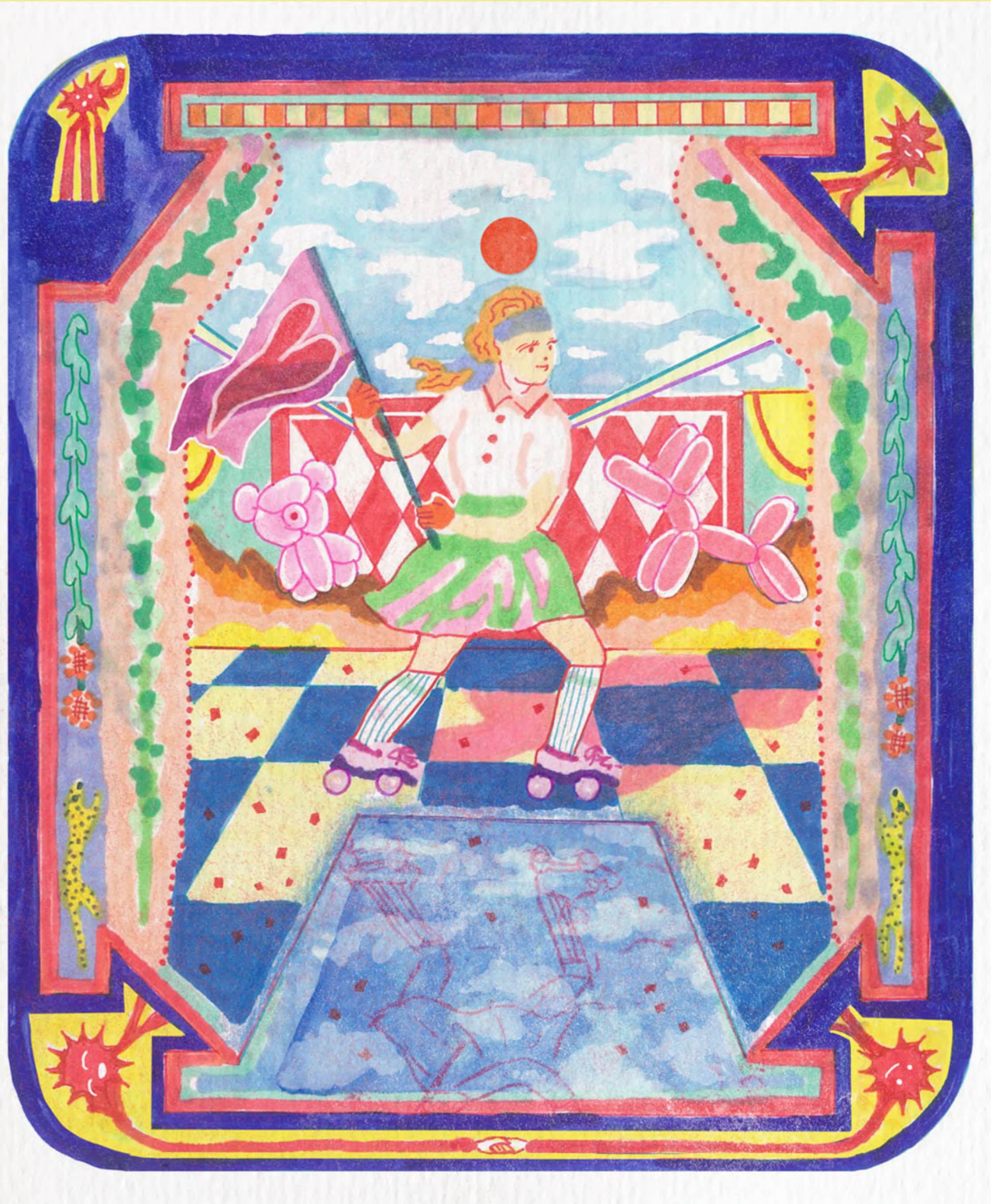
« fight for your heart » featured on "It's Nice That" 2021