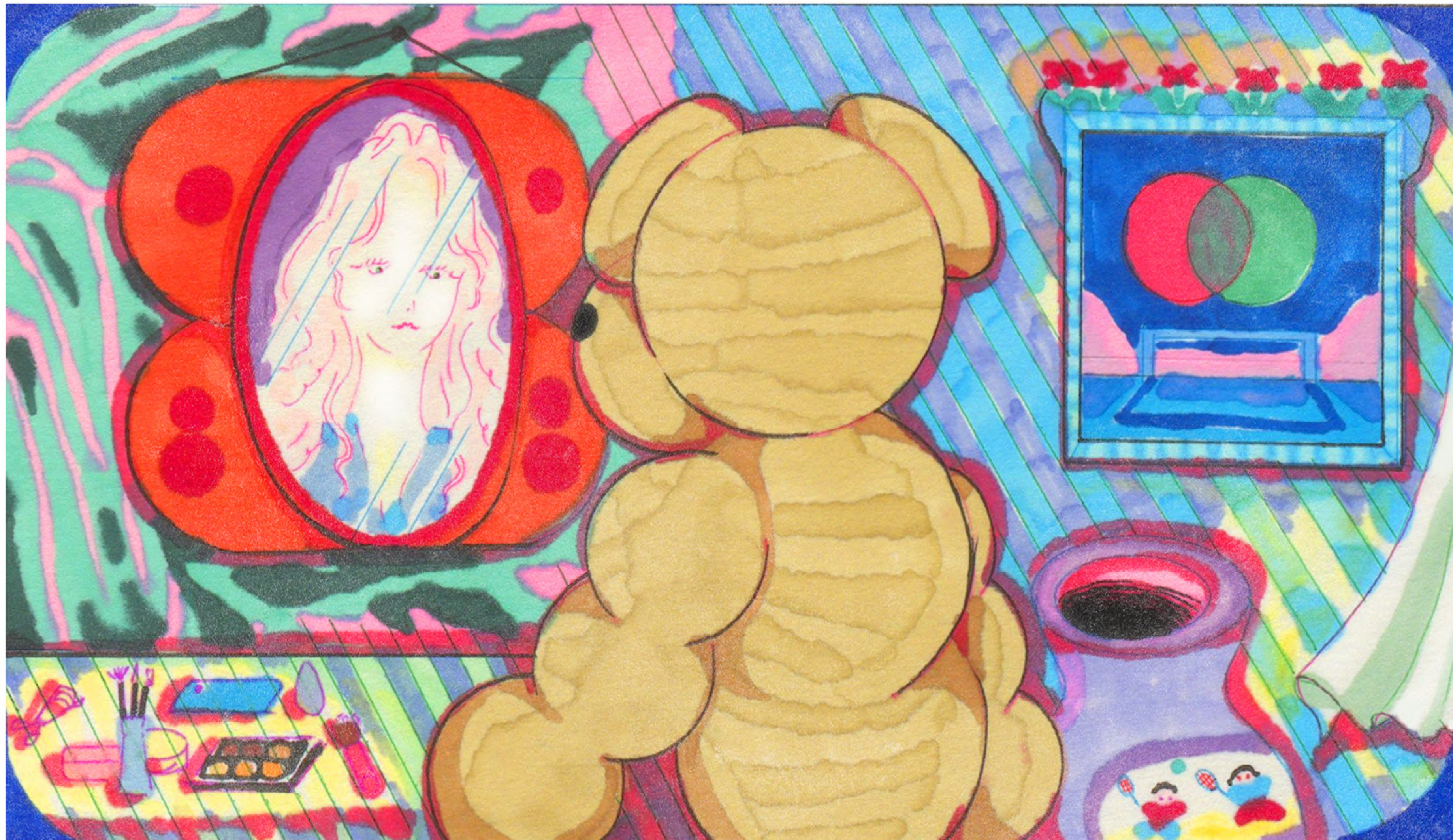
« Moi dans le miroir » 2024