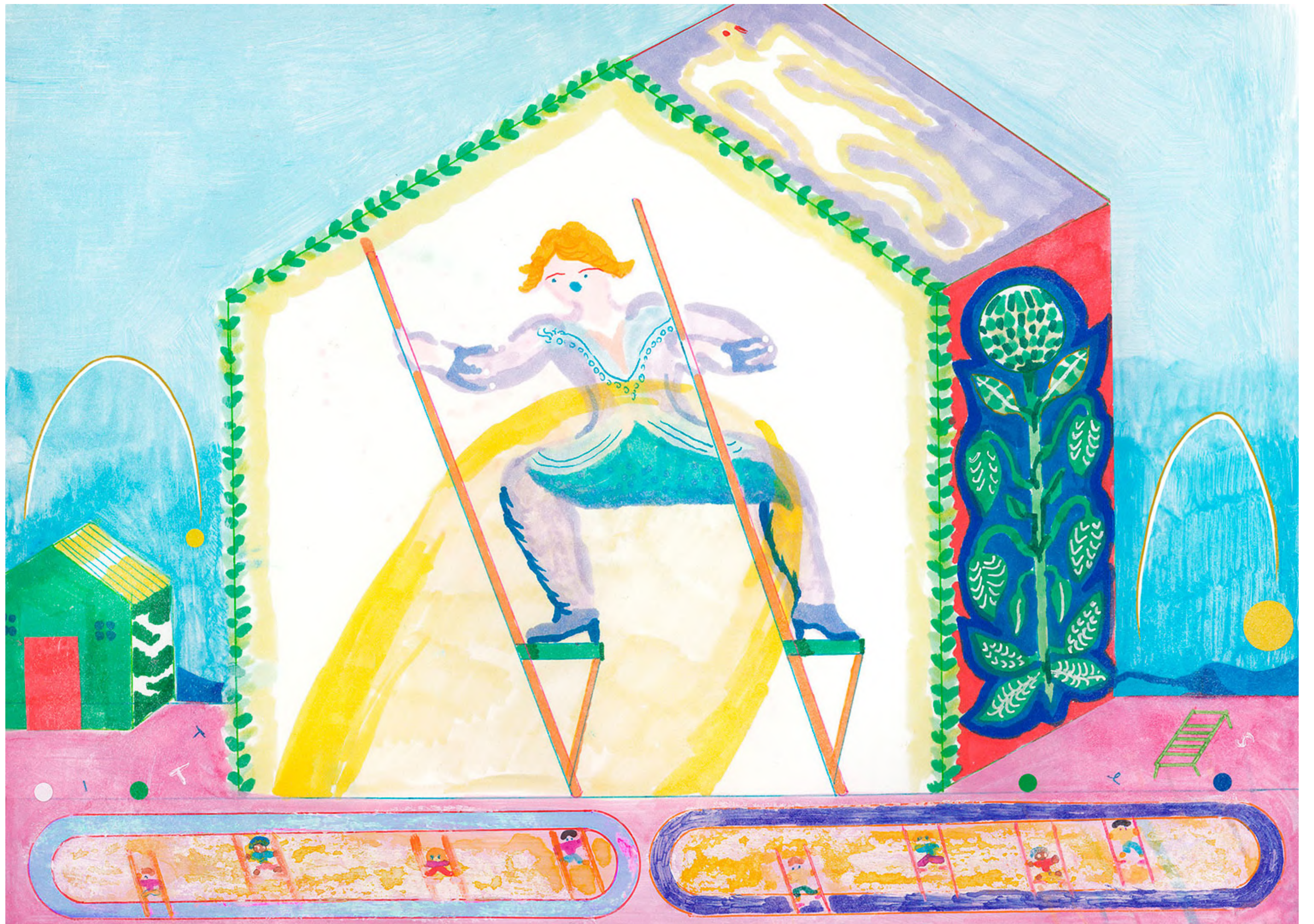
« Prince of Stilts » 2024